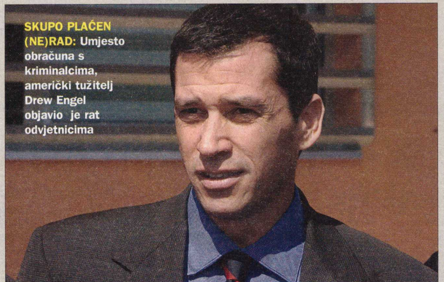
SKUPO PLAĆEN (NE)RAD: Umjesto obračuna s kriminalcima, američki tužitelj Drew Engel objavio je rat odvjetnicima

nekadašnjem članu Predsjedništva BiH Anti Jelaviću (osuđenom na deset godina zatvora) koju je Apelacijsko vijeće Suda BiH u cijelosti odbacilo i suđenje Jelaviću vratilo na početak. (Ranije smo objavili da je žalba Jelavićevih odvjetnika bila napisana na više od sto strana, dok je Engel svoje pritužbe "stavio" na svega pet stranica.) U ljeto 2006., konačnom presudom Apelacijskog vijeća, Drew Engel je izgubio i sudski spor protiv bivšeg federalnog ministra obrane Miroslava Prce i dozopovjednika Vojske Federacije Dragana Čurčića, koji su oslobođeni u predmetu "Hrvatska samouprava". Međutim, i pored katastrofalnih rezultata, Engelu je u dva navrata produžavan mandat. Nakon što se njegov prethodnik i sunarodnjak David Upcher prije godinu dana vratio u SAD, Drew Engel je "promoviran" u šefa Posebnog odjela za organizirani kriminal, privredni kriminal i korupciju Tužiteljstva BiH.